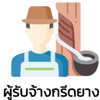
ผู้รับจ้างกรีดยาง

การจัดจำแนกสถานภาพการทำงาน ของ "การรับจ้างกรีดยาง"